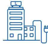
Versandsicht Lieferant (Prozess-ID 37000)

Jede Marktrolle ist dabei sowohl Sender als auch Empfänger :