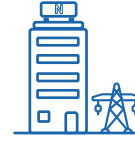
Versandsicht Netzbetreiber (Prozess-ID 37001)