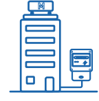
Versandsicht MSB (Prozess-ID 37002)